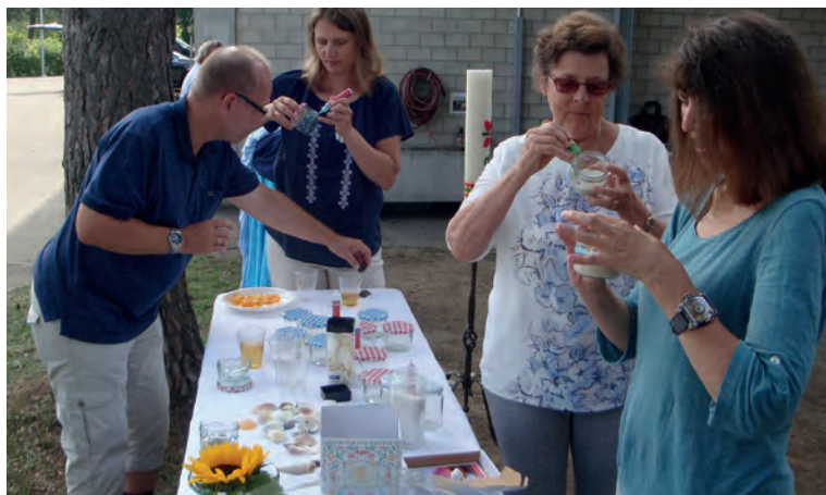
Familien-Gottesdienst am Sonntag, 27. August, im Spielraum ARA Glatt

Donnerstag, 5. Oktober, 12 Uhr Kirchgemeindehaus