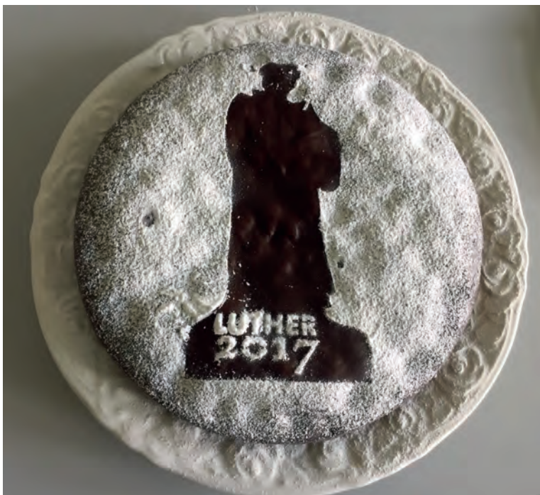
Jubiläumskuchen 500 Jahre Reformation